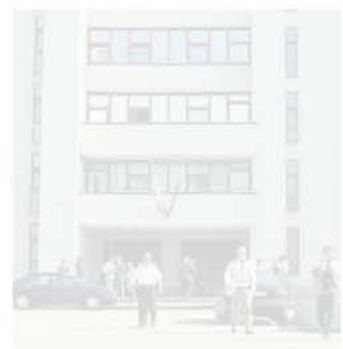
Il Tribunale di Bari