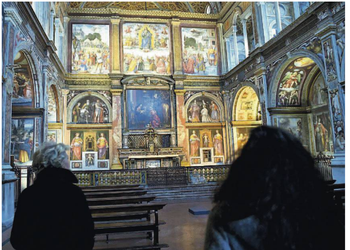
I restauri della chiesa fondata nel 1502 e per molti anni semiabbandonata sono terminati nel 2015

La definizione di Sistina non è affatto un'iperbole. Si tratta davvero di un gioiello del rinascimento rivestito da migliaia di metri quadri di affreschi di scuola lombarda. Tra le firme famose, quella di Bernardino Luini con bottega e figli, quella di Simone Peterzano, il maestro di Caravaggio, quelle del Bergognone e di Antonio Campi. Tra i segreti miglio-