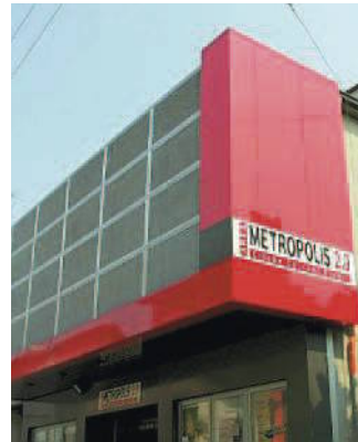
L'Area Metropolis a Paderno