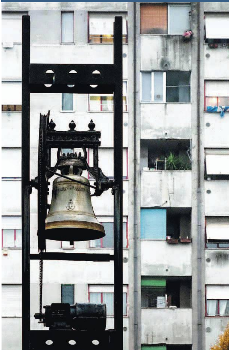
Le campane di San Galdino e dietro le case bianche